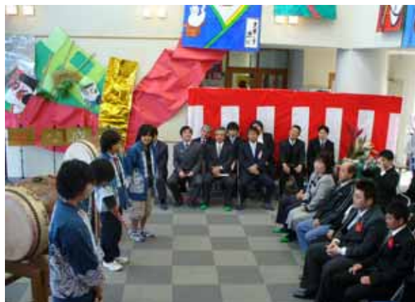
(還住太鼓クラブ中学生によるお祝いの言葉)