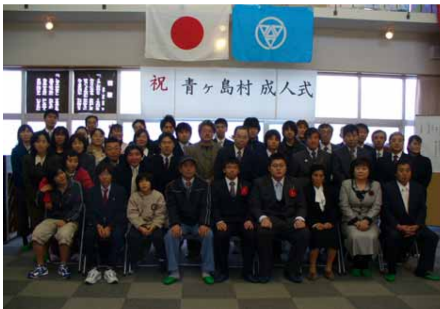
1 月 11 日 平成 21 年成人式