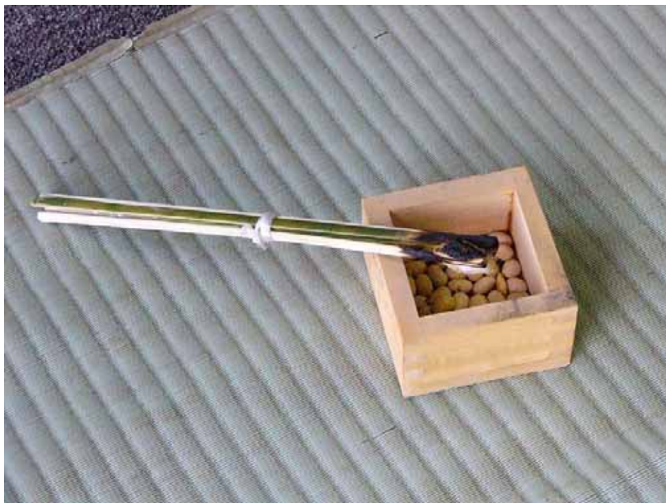
2 月節分・青ヶ島の厄除けの神事「フクサ」で使用された道具