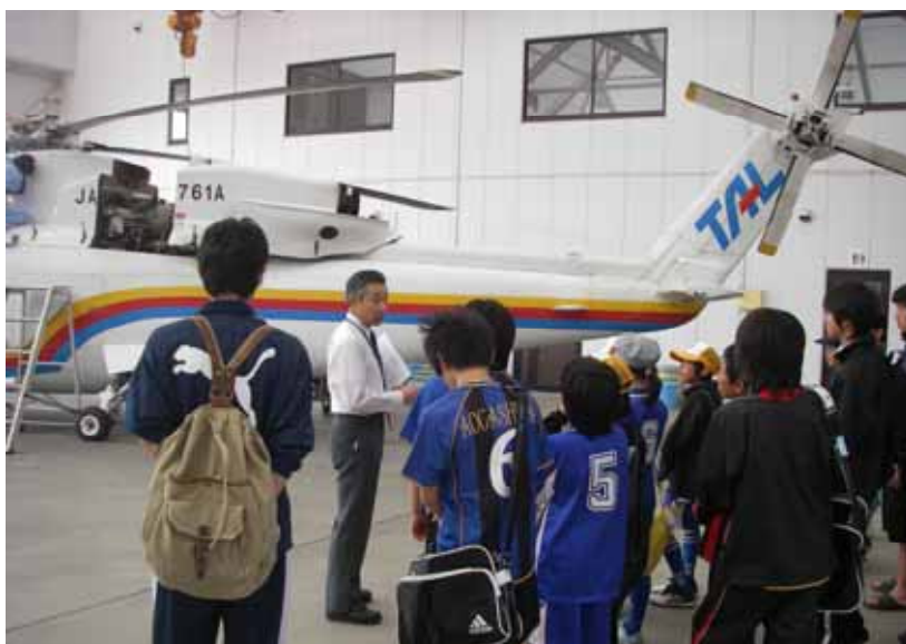
平成 21 年度東京都多摩・島しょ子ども体験塾事業 (東邦航空見学)