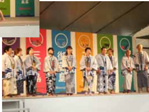
5 月 22 日 23 日 島じまん 2010 遷住太鼓・郷土芸能保存会 (竹芝棧橋・竹芝客船ターミナル)