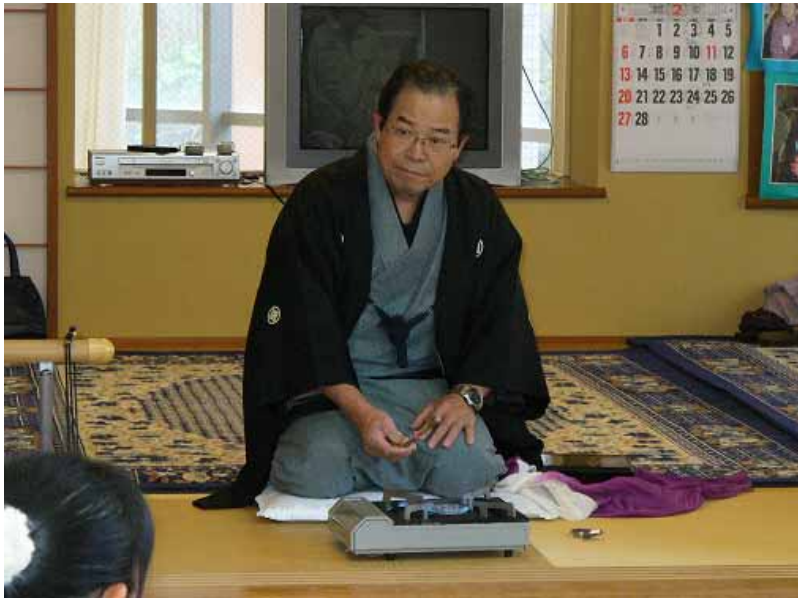
2月3日 保育園 節分交流会