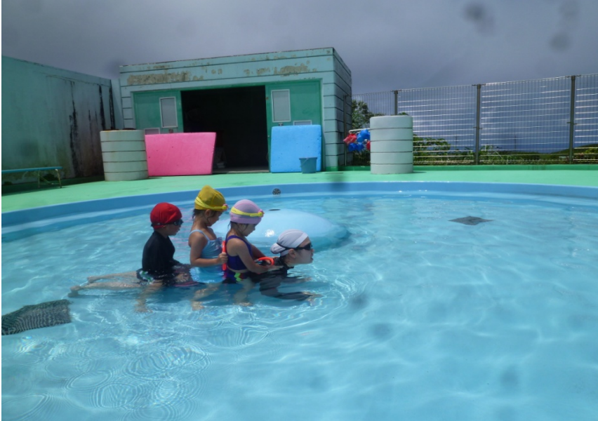
保育園プール開き