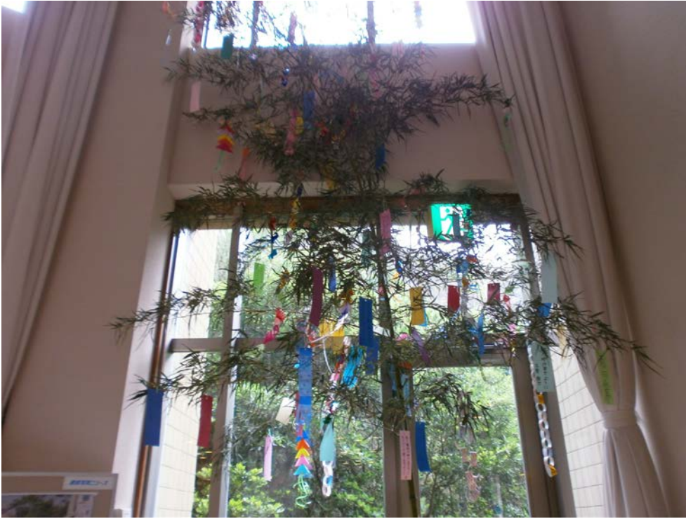
平成26年7月7日 七夕飾り