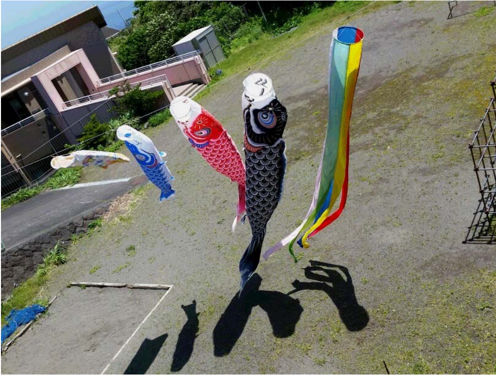
こいのぼり (青ヶ島村保育園庭より)