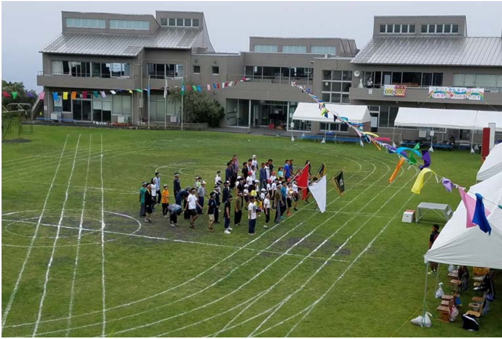
9月21日 青ヶ島小中学校運動