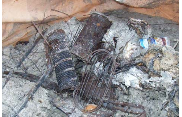
焼却灰に入っていた金属類の一部です

可燃ごみに金属類が混入しないよう、各ご家庭・職場等でのごみの捨て方を再度見直していただきますようお願いいたします。