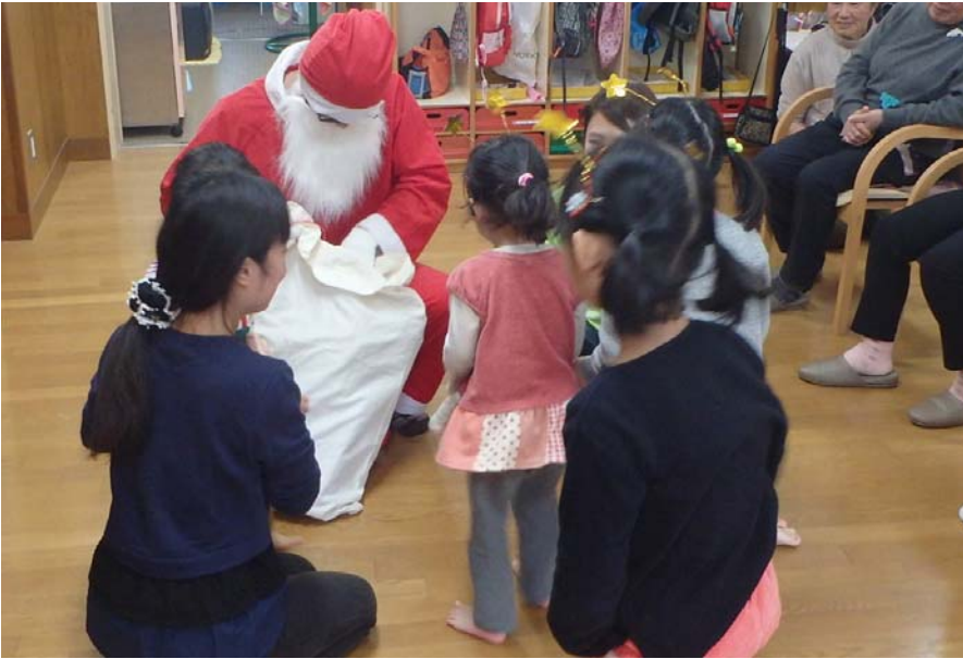
保育園クリスマス交流会