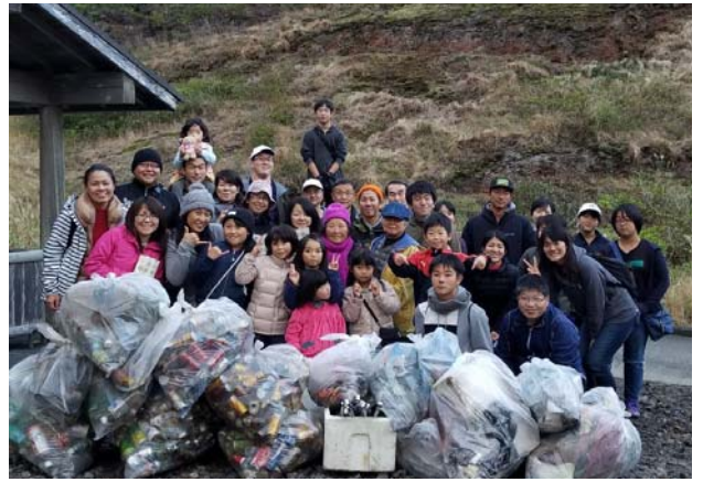
参加者のみなさんと拾ったごみです

今回の売り上げから、歳末たすけあいに金59,601円を寄付しました。ご協力ありがとうございました。 (青ヶ島村社会福祉協議会)