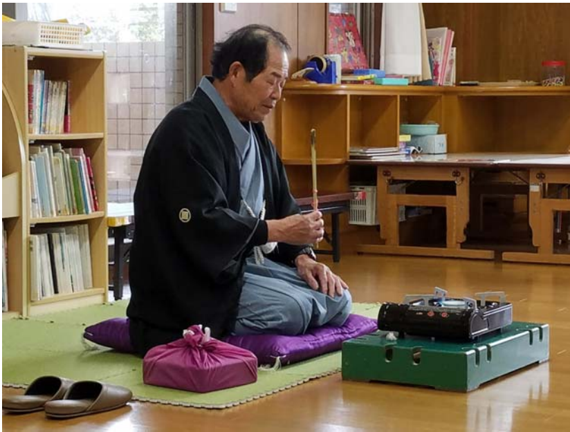
平成 30 年 2 月 2 日 節分交流会(フクサ)