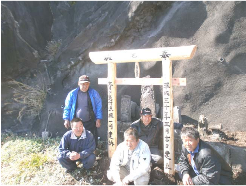
平成30年3月 船主による鳥居の建立 『三宝大明神』