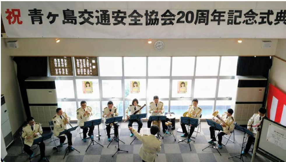
青ヶ島交通安全協会創立 20 周年記念式典「音楽隊による演奏」