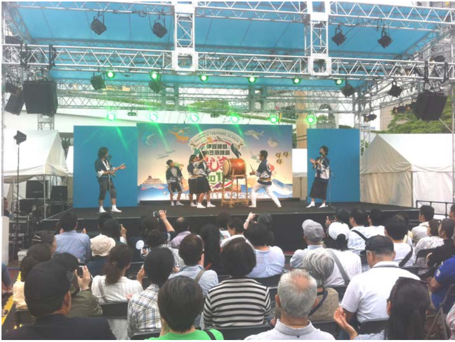
平成 30 年 5 月 26 日(土)27 日(日)に開催された『島じまん 2018』ステージにて 島の子どもたちによる還住太鼓の演奏