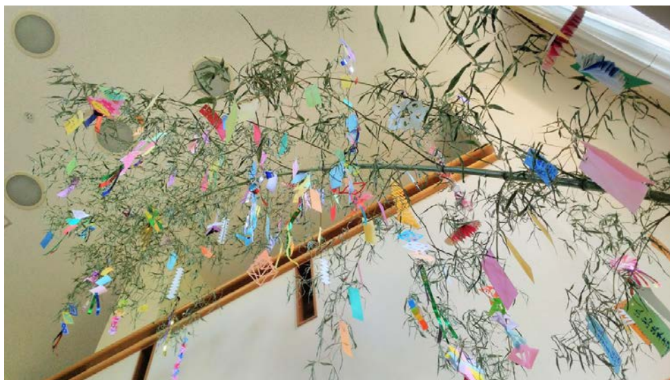
平成30年7月7日 七夕飾り おじゃれセンターにて