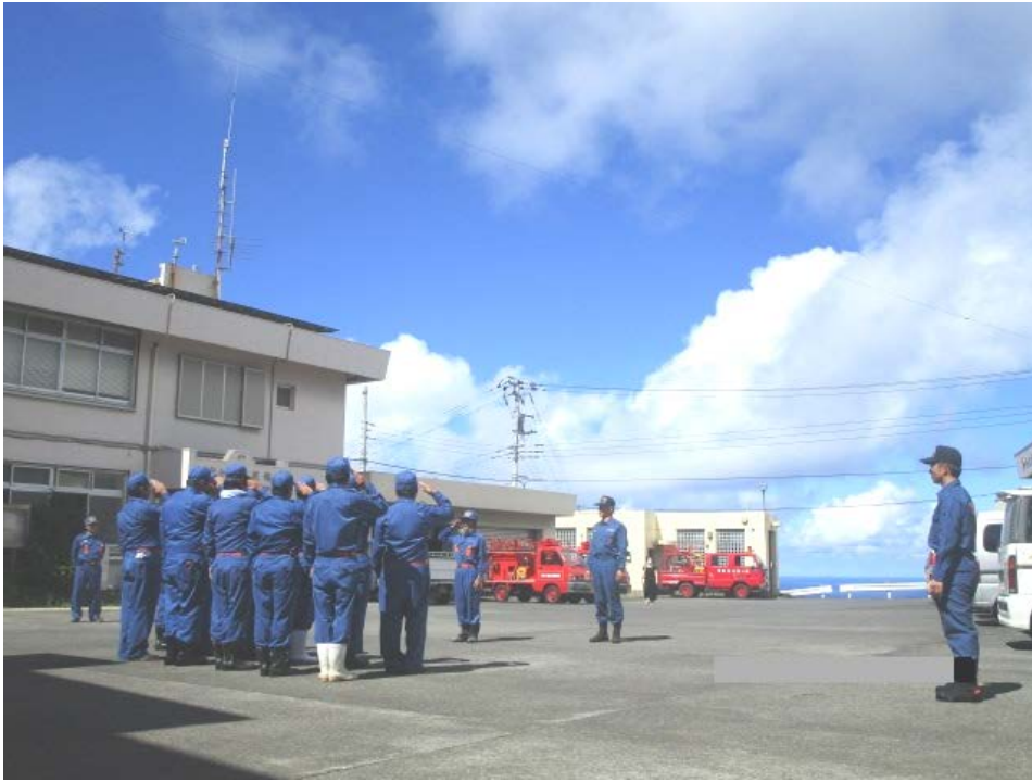
平成30年8月30日(木)青ヶ島村消防団教育訓練