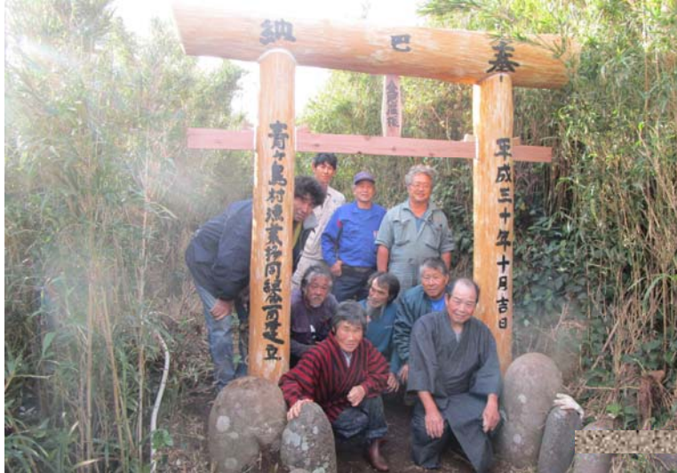
平成30年10月 『海の口閉め』 船主による鳥居の建立「金毘羅様」