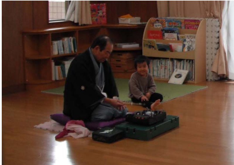
青ヶ島節分の伝統行事「フクサ」（保育園）