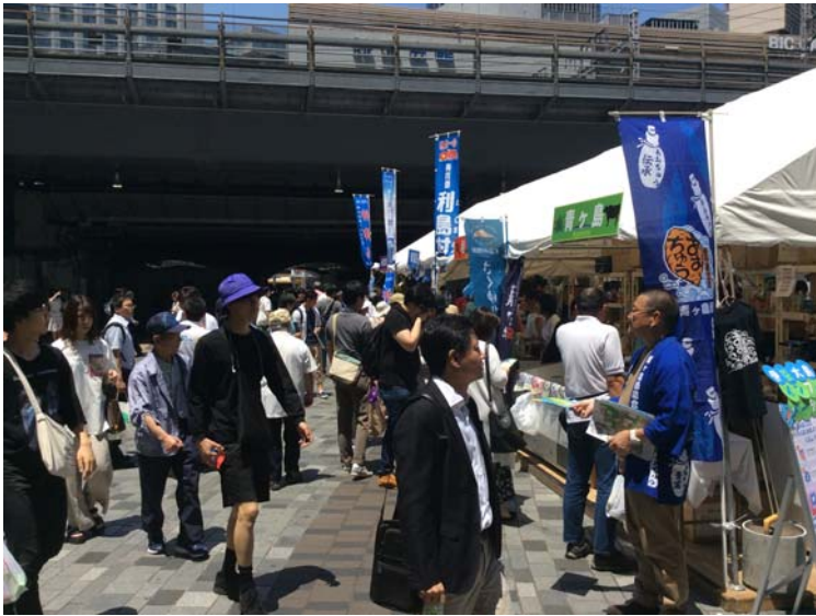
5 月 24～25 日東京愛らんどフェア 2019